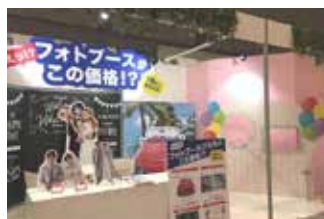
【ブライダル産業フェア 2016】